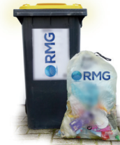
Gelbe Säcke & Tonnen